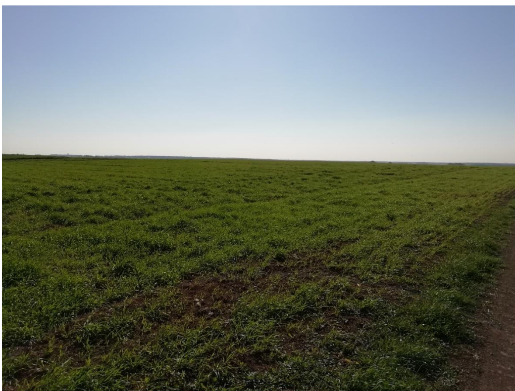
Photographies du 15/05/2020 permettant de situer le projet dans son paysage lointain, prise par la Chambre d'agriculture du Loiret