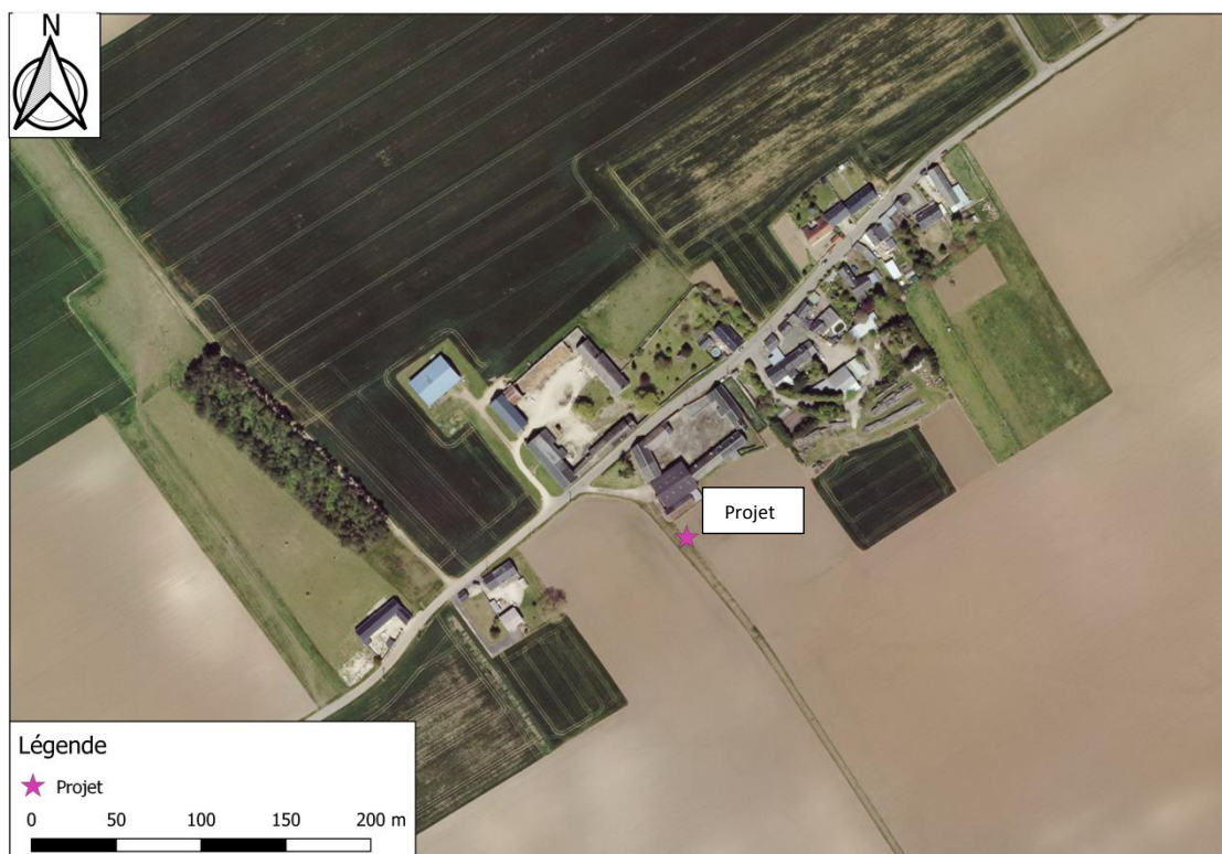
Photographie aérienne extraite du site Géoportail le 15 Juin 2020 permettant de situer le projet (en rose) dans son environnement proche